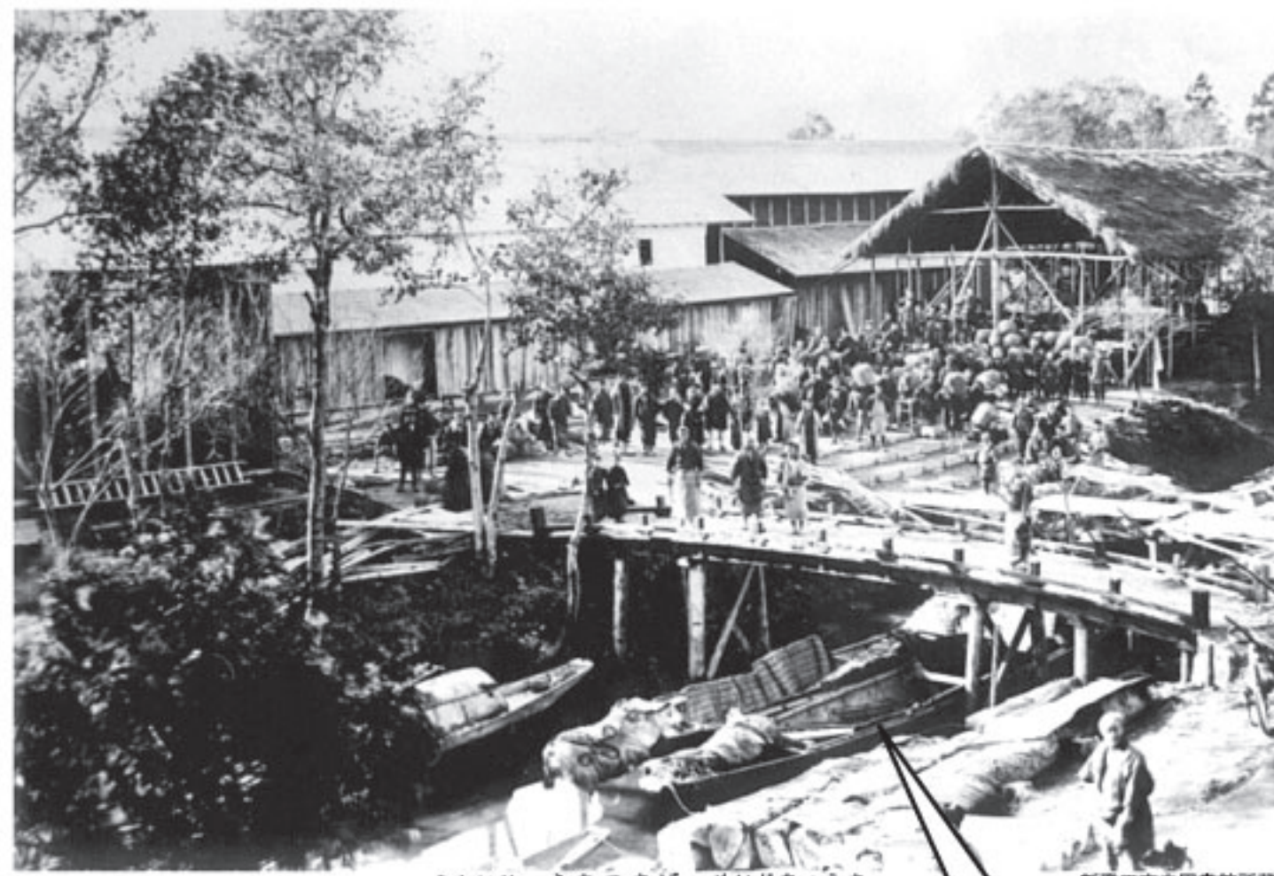
ふないり ふなつきば (めいじちゆうき) 舟入の船着場 (明治中期)

その他にも、お風呂の水や道へまく水も新発田川の水を使っていたんだ。生活するために、新発田川は大切なものだったんだよ。