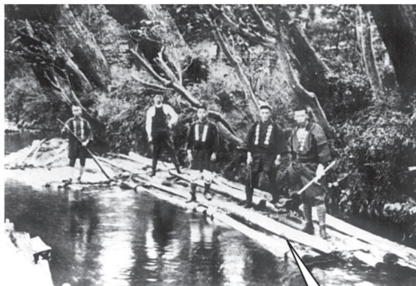
なが いかだ流し (めいじちゆうき) (明治後期)