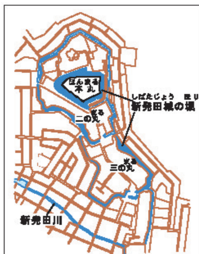
「新発田城」城下町新発田400年のあゆみ」新発田市より作成 新発田城城郭図（江戸末期）