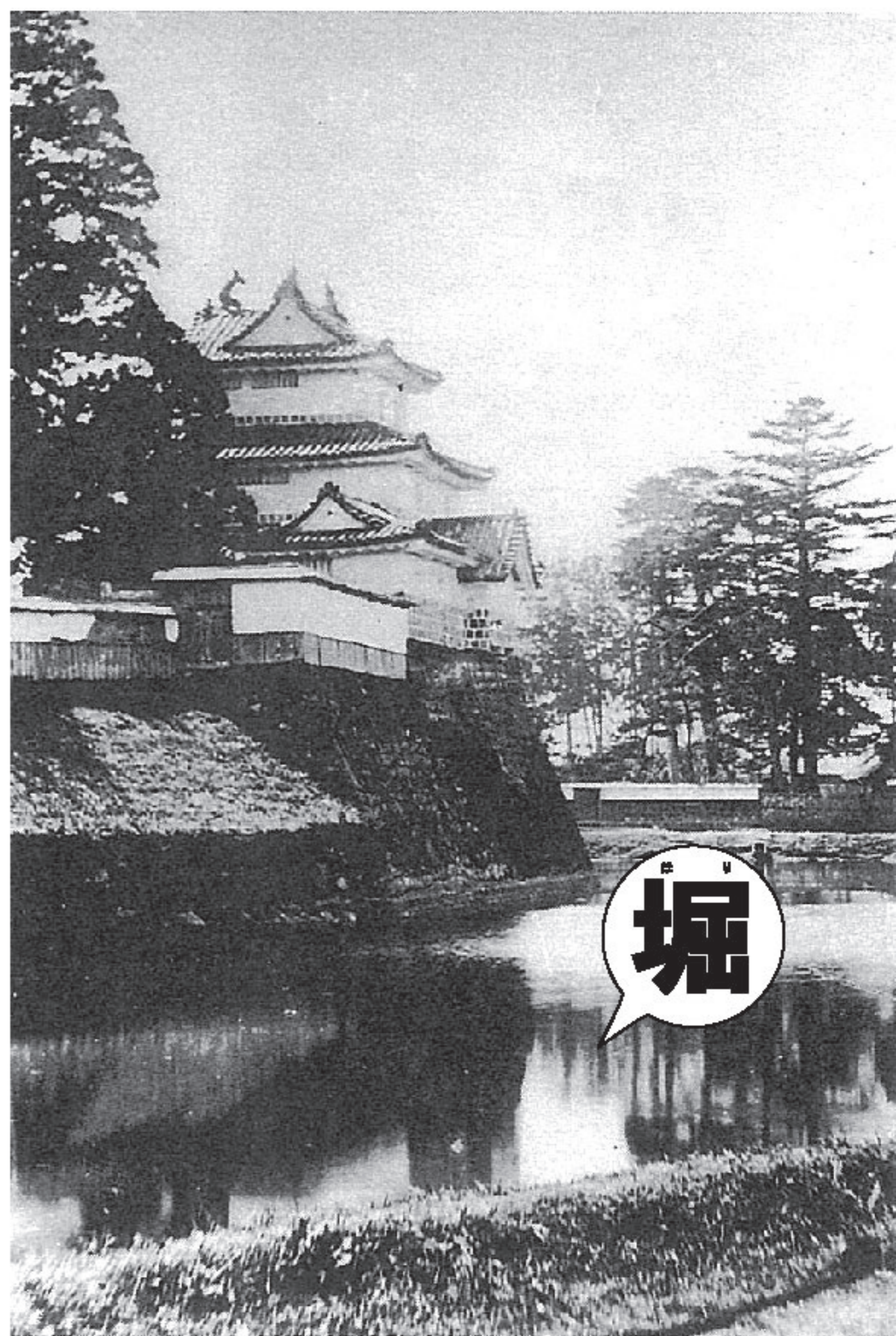
「新発田・村上の歴史」郷土出版社 新発田市立歴史資料館 しばたじょうほんまるさんかいやくら めいじごねんごら 新発田城本丸三階櫓（明治5年頃）