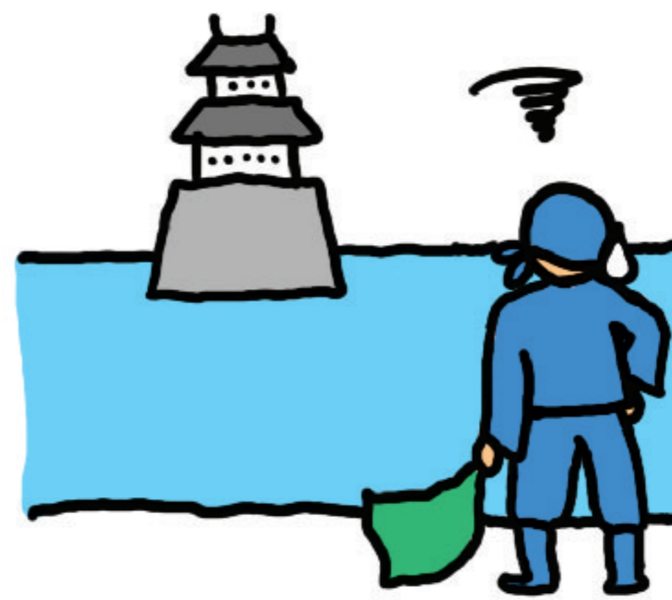
お城にどろぼうが入らないようにするため