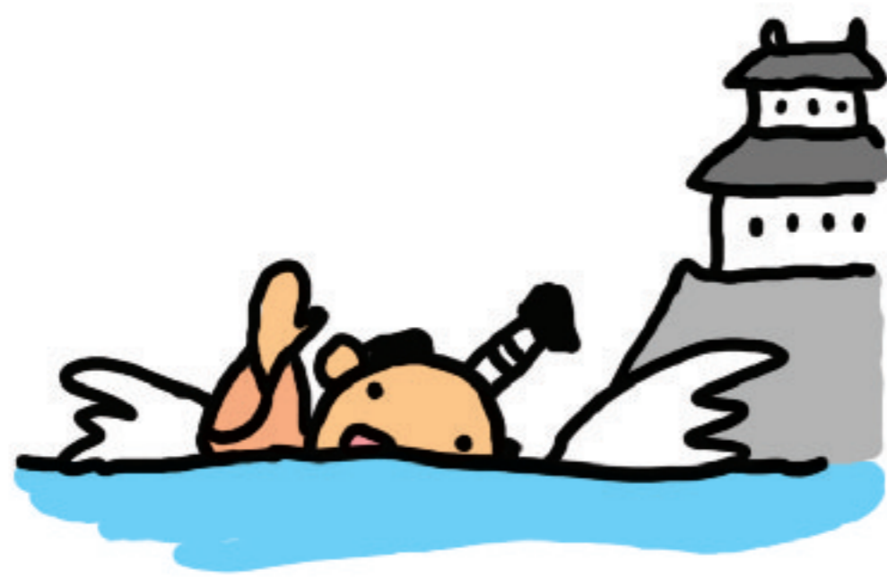
おとのさまが水遊びをするため