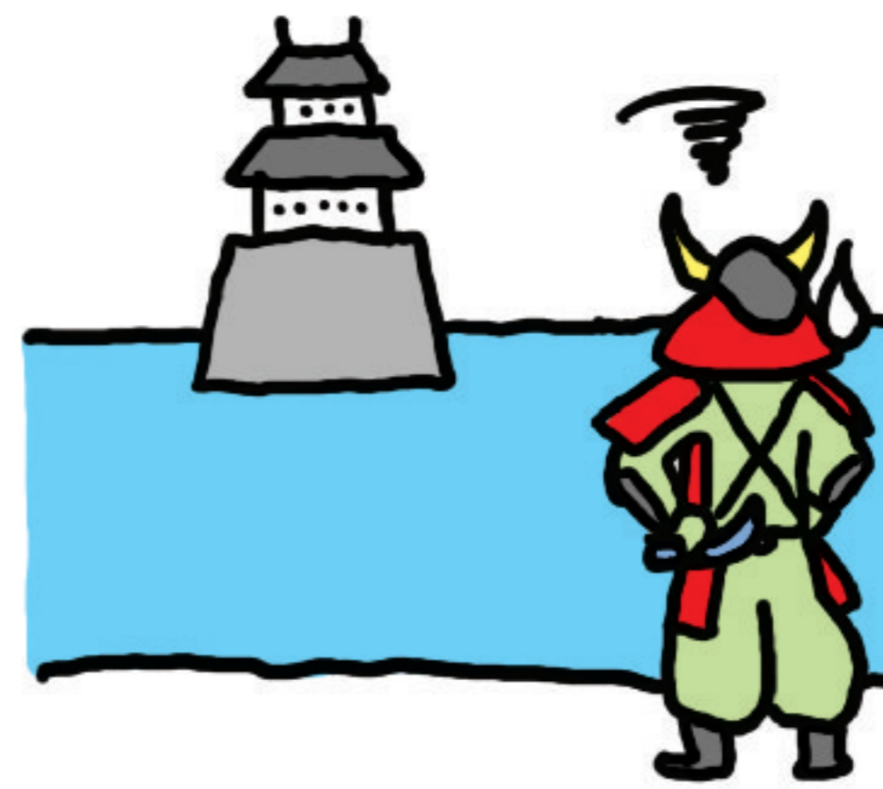
敵がお城に入ってくないようにするため