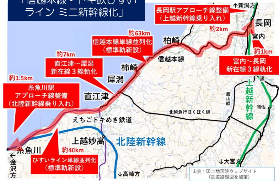
【案1-2】 「信越本線・トキ鉄ひすい ラインミニ新幹線化」