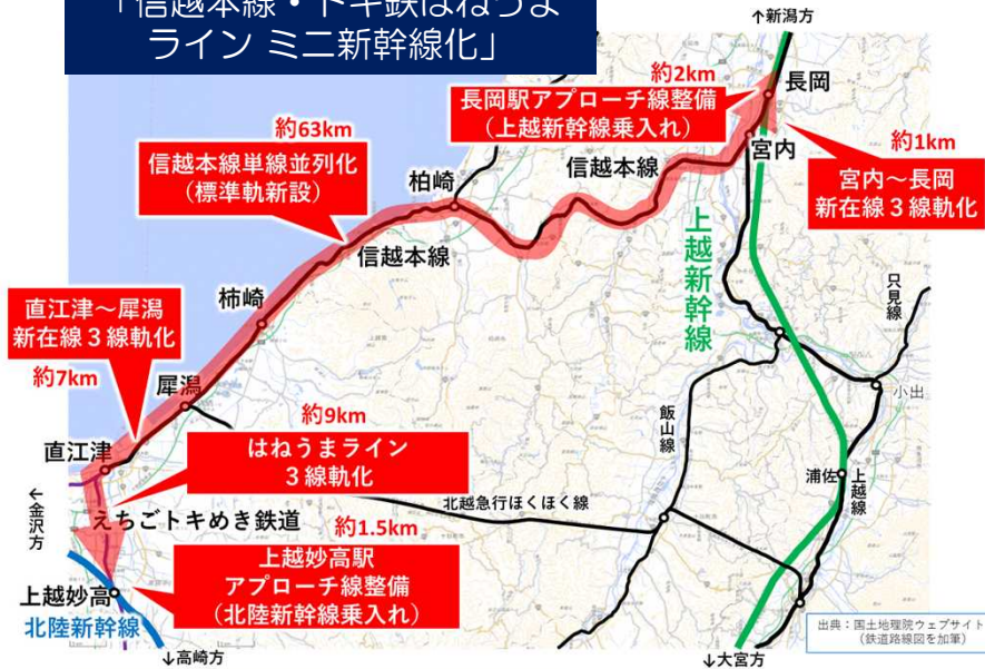
【案1-1】 「信越本線・トキ鉄はねうま ラインミニ新幹線化」