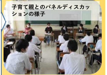
子育て親とのパネルディスカッ ションの様子

地域の魅力発 信や課題解決 に向けた実践 的活動を、地 域の方々と一 緒に行ってい ます。