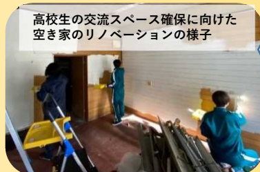
高校生の交流スペース確保に向けた 空き家のリノベーションの様子

ネットワーク校の生徒同士が、 対面やオンラインで、探究学習 の成果を合同で発表する機会を 設けています。