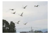
飛び立つコハクチョウ