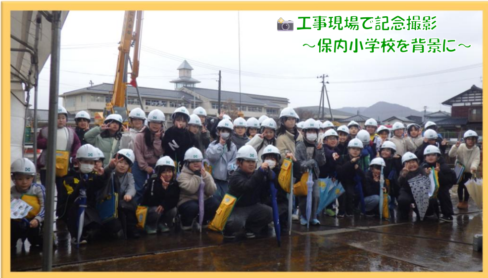
📷 工事現場で記念撮影 ～保内小学校を背景に～

保内小学校の先生方ならびに株式会社 渡辺組の皆様、ご協力ありがとうございました。