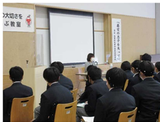
「令和 4 年度 命の大切さを学ぶ教室」の開催の様子