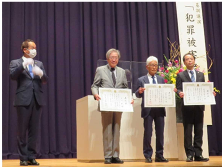
「表彰式(被害者支援フォーラム)」の様子