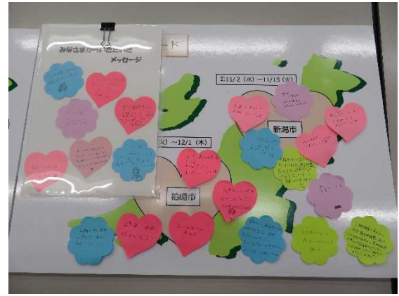
「巡回パネル展」の開催の様子