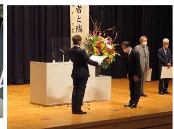
「犯罪被害者支援フォーラム 2022 in にいがた」の開催の様子