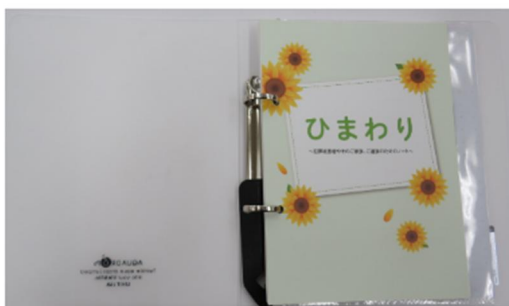
A5版リングファイル形式