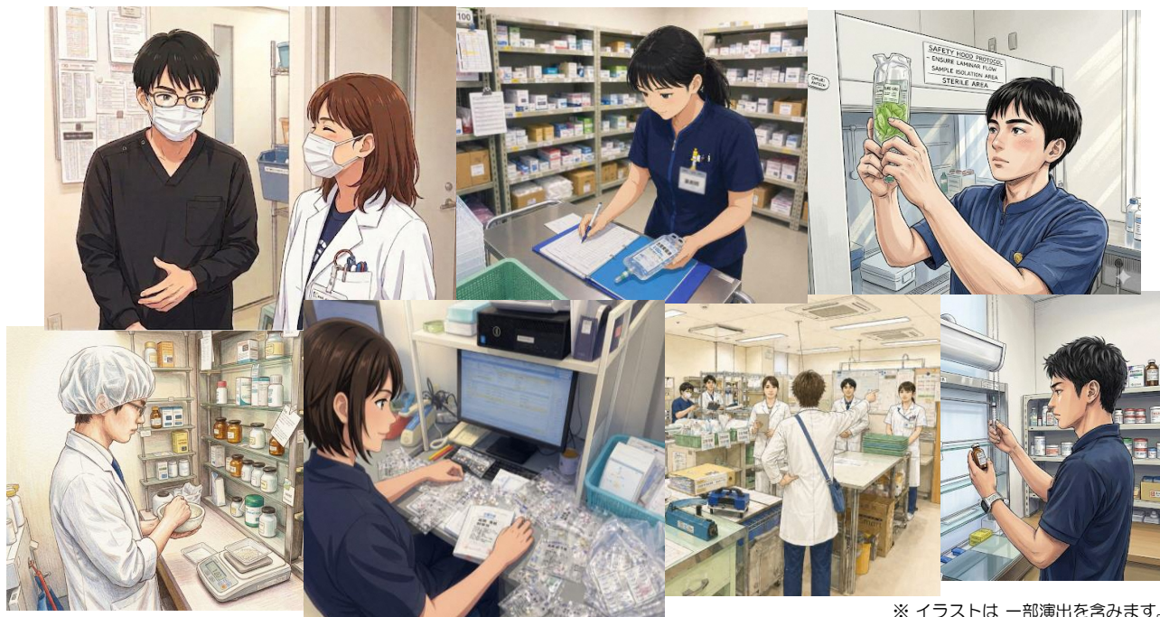
※イラストは一部演出を含みます。 リアルは見学でお確かめください。