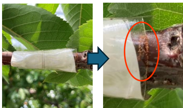
幼虫を捕獲した両面テープトラップの様子

5～7日間隔で観察し、発生が多くなってきたら薬剤防除適期 ※粘着力が弱くなったら随時交換