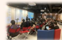
フードテックピッチイベントの開催