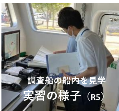
調査船の船内を見学 実習の様子（R5）

実習場所：水産課、水産海洋研究所、内水面水産試験場 実習内容：漁船登録事務、調査船の業務見学 等 実習時期：大学院1年生の夏休み（1週間）