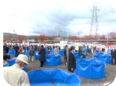
錦鯉品評会の開催・支援