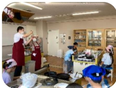
小学生向け水産教室の開催